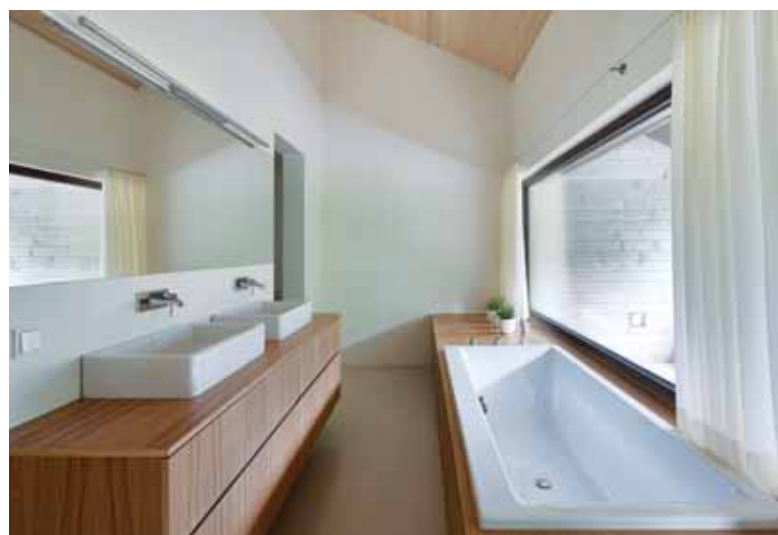
Blick aus dem Innenhof (o.) und das komfortable Badezimmer.