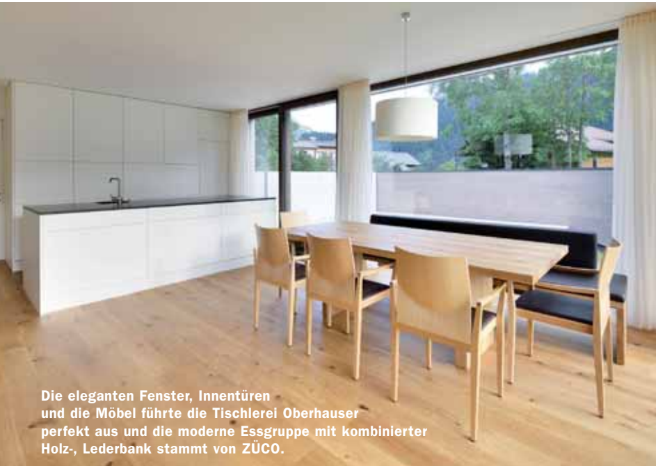
Die eleganten Fenster, Innentüren und die Möbel führte die Tischlerei Oberhauser perfekt aus und die moderne Essgruppe mit kombinierter Holz-, Lederbank stammt von ZÜCO.