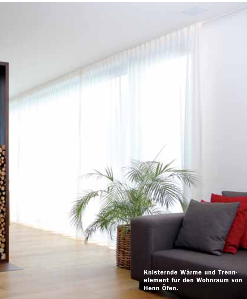
Knisternde Wärme und Trennelement für den Wohnraum von Henn Öfen.