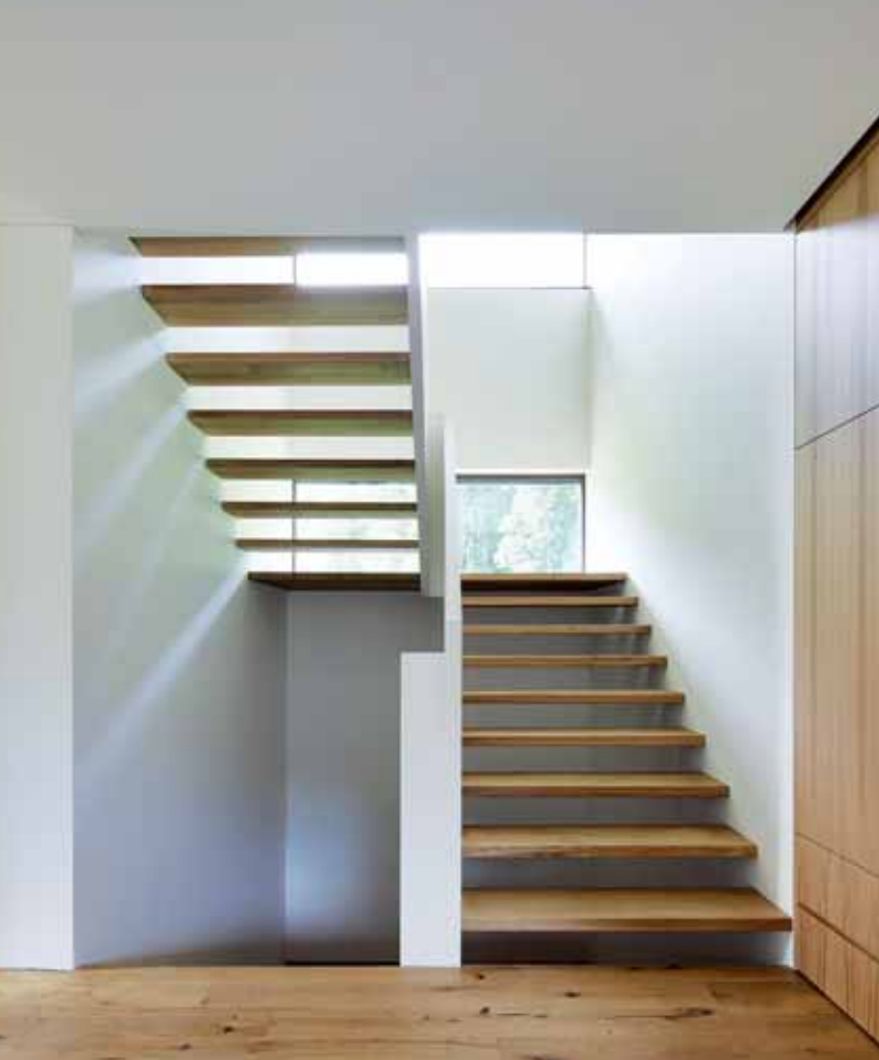
Man sieht: Holz spielt die Hauptrolle im Inneren und auch im Fassadenbereich.