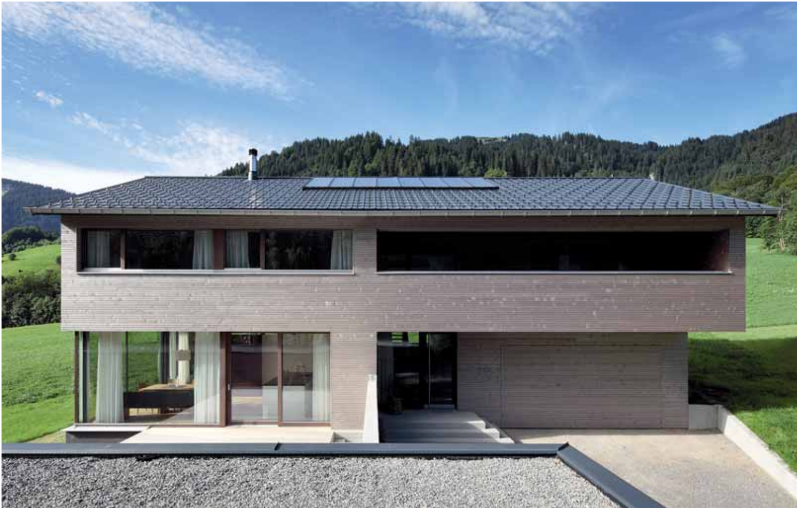
Unter der PREFA Dachplatte P.10 in Anthrazit breitet sich die Wohnfläche auf zwei Geschosse aus.